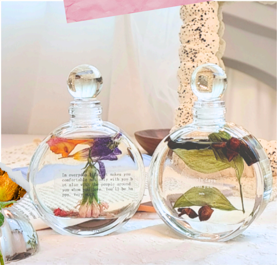
인테리어 플라워 디퓨저