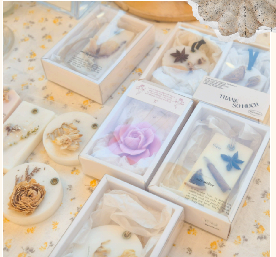
왁스 타블렛 방향제